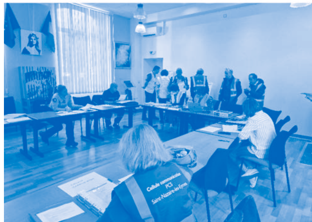
Poste de Commandement Communal (PCC)

Bilan de la journée : 1,5 hectares de forêt brûlés dans le sud de la commune, pas de blessés ni de dégâts matériels, des équipes rassurées sur leur capacité à faire face à ce type d'évènements, et de nombreuses pistes d'amélioration de nos procédures.