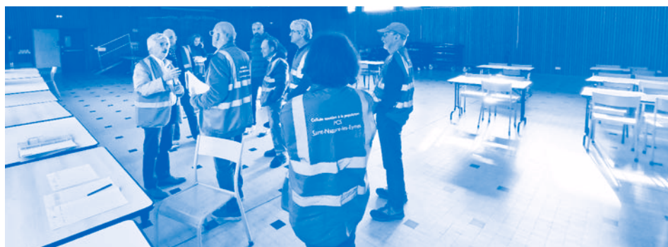
Mise en place du centre d'accueil en salle CARTIER-MILLON